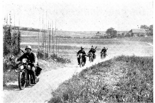
Dienst des Unteroffiziers. Leichte Truppen: Die große Beweglichkeit der motorisierten Kampftruppen erfordert von den Unteroffizieren, die sehr oft auf längere Zeit von ihrem Verbandsdetachment werden, Selbständigkeit sowohl in taktischer Beziehung, wie auch in Fragen der Disziplin und der Retablierung.

Pour la première fois depuis la guerre, elles furent organisées à nouveau en 1925, à Zoug, sur des bases extrêmement fragiles, étant donné que les expériences