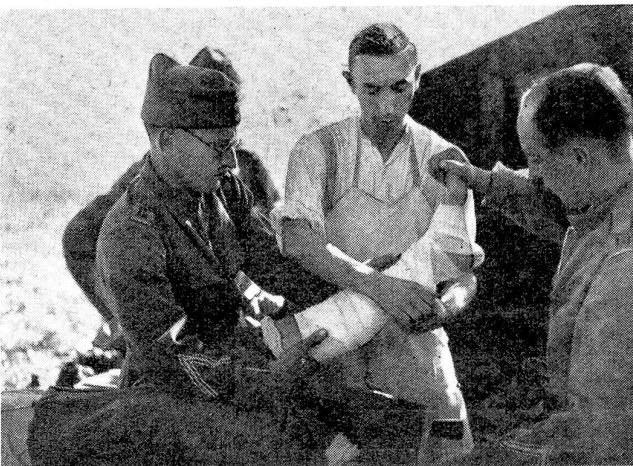
Dienst des Unteroffiziers. Sanität: Auf dem Verbandplatz ist der Unteroffizier Gehilfe des behandelnden (operierenden) Arztes.

Service du sous-officier. Santé: A l'infirmerie, le sous-officier est l'aide du médecin traitant (chirurgien éventuellement).