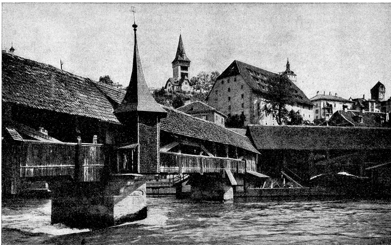
Spreuerbrücke, Zeughaus und Museggtürme • La Spreuerbrücke, l'Arsenal et les Tours Musegg • Il ponte Spreuer, l'arsenale e le torri di Musegg

halt 1929» steht eingangs mit vollem Recht: «Die Leistungsfähigkeit einer Truppe hängt von deren Ernährung ab. Nur ein genügend und richtig ernährter Mann ist den Anforderungen des Militärdienstes gewachsen.» Diese unsere Truppe besteht aber aus gesunden, in der Vollkraft ihrer Jahre stehenden Wehrmännern, die nicht mit Vitaminen aufzupäppeln sind, oder irgendeiner diätetischen Schonkost bedürfen . Sie haben das Recht und auch das Bedürfnis nach einer einfachen, kräftigen und abwechslungsreichen Kost, die ihren zivilen Lebensgewohnheiten soweit als möglich entgegenkommt. Unsere heutige, kunstgerecht und schmackhaft zubereitete Soldatenkost erfüllt in hinreichendem Maße diese Bedingungen. Es kann keine Rede davon sein, daß sie einen Mangel an Vitaminen aufzuweisen habe, ebensowenig wie die gewöhnliche durchschnittliche Kost unserer Bevölkerung. Es sind grundlose Befürchtungen (um nicht mehr zu sagen), wenn behauptet wird, die Schlagfertigkeit unserer Truppe leide durch vermeidbare Ernährungsfehler und darum seien die Grundlagen der Soldatenernährung in der Schweiz zu überprüfen.