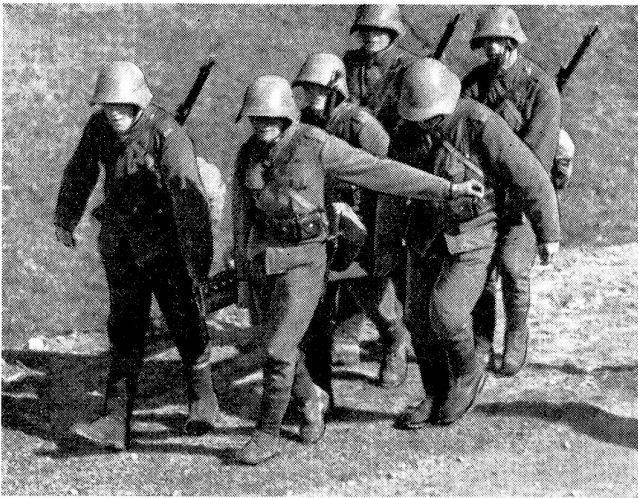
Bautrupps beim Transport eines schweren U-Stahlbalkens zum Einsatz in eine größere Tanksperrung.

Transport d'une lourde barre d'acier en U destinée à un barrage contre tank plus important.