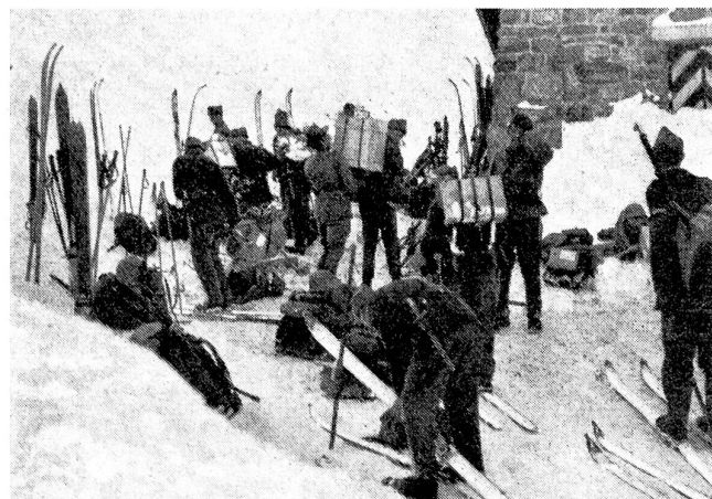
Ankunft einer Transportkolonne mit Lebensmitteln bei der Wildhornhütte, 2306 m ü. M.

Nachdem von den ausgesandten Patrouillen die Schnee-verhältnisse im Abschnitt Wildhorn — Schneidejoch, nament-