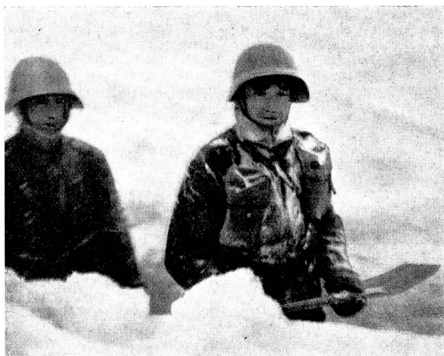
Lmg.-Trupp beim Eingraben im Schneesturm. Fusiliers-mitrailleurs creusant un abri pendant une tempête de neige. Gruppo di M.L., nella tormenta, scavano la neve.