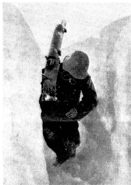
Stellungsbezug eines Mg. durch Schneeaufgraben.

lich aber am Steilhang des Kirchli, als gut und sicher gemeldet worden waren, ging Dienstagmittag eine Hochgebirgspatrouille von 16 Mann — darunter einige Berufsbergführer — über Schneidejoch — Rawilpaß — Wildstrubelhütte nach der Gemmi zur Herstellung der Verbindung mit dem dortigen — supponierten Bataillon ab. Von zwei Infanterie-Gruppen, einem Detachement Mitrailleurs mit 1 Mg. und einer Telephonstation wurde am Spätnachmittag der Abschnitt Schneidejoch — P. 2912 am Ténéhet-Gletscher besetzt. Die Truppen hatten sich in Schneehöhlen einzurichten, um diesen Abschnitt auch während der Nacht halten zu können; das Vorgelände war durch Beobachtungsposten und Verbindungspatrouillen ständig zu sichern. Mit der Wildhornhütte als Kommandoposten des Abschnittes bestand Telephonverbindung. Die Truppe war ausreichend mit Lebensmitteln und Brennmaterial versehen, so daß sie sich wiederholt warm verpflegen konnte. Der Aufenthalt in den zweckmäßig angelegten Schneehöhlen gestaltete sich durchaus erträglich, trotz des schweren Föhnsturmes, der gegen Mitternacht eingesetzt hatte. Die einzige Klage, die von der Truppe später vorgebracht wurde, war diejenige über eiskalte Füße. Es zeigte sich auch hier wiederum, daß selbst das beste Schuhwerk — die Leute waren zum Teil mit geradezu hervorragendem Schuhzeug zum Dienste eingerückt — nicht