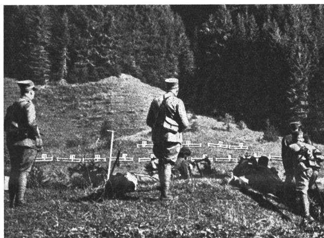
2. Hochgebirgswettmarsch der Geb.-Brigade 9. Auf dem Schießplatz bei Suldtal-Säge. Im Vordergrund einige Offiziere des dortigen Kontrollpostens.

Bei prachtvollem Herbstwetter fand am Sonntag, 29. September, von Reichenbach im Kandertal aus auf der Strecke Kiental, Gornern, Tellipaf, Gütsch, Lat-treien, Suldtal, Reichenbach der zweite Hochgebirgs-Wettmarsch der Gebirgsbrigade 9 (Bern und Wallis) statt, an welchem insgesamt 26 Patrouillen aus den Truppen dieses Heereskörpers starteten. Die Strecke war mit 42 km Länge gegenüber dem Wettmarsch von 1933 um 3 km kürzer, dagegen mußten mit insgesamt 2937 m Steigung, über 300 m mehr als 1933, überwunden werden; zudem war der Parcours allgemein betrachtet bedeutend schwieriger und anstrengender als der frühere. Sämtliche wichtigen Durchgangspunkte waren mit Kontroll- und Sanitätsposten besetzt und durch die von über 30 Pionieren der Gebirgstelegraphen-Kompanie 13 gelegten Feldtelefonleitungen mit dem Kommandoposten Reichenbach