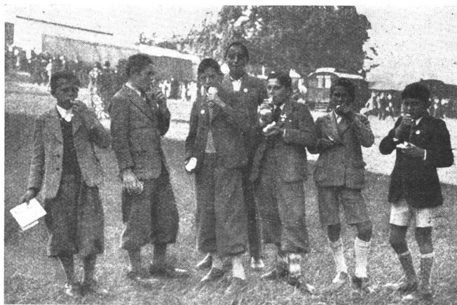
Vom Knabenschießen im Albisgütli-Zürich. Die traditionelle Bratwurst gehört zum Knabenschießen wie der «Bögg» zum Sechseläuten.

A propos du «Knabenschießen» à l'Albisgütli-Zürich. Le «Knabenschießen» a sa traditionnelle saucisse rôtie tout comme le «Sechseläuten» a son «Bögg».