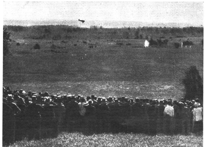
Demonstration in Kloten. Beschießung von Infanteriezielen durch Flieger. Deutlich ist die Geschoßgarbe (weiße Wölkchen) des Kampfeinsitzers im Ziele erkennbar, weiter rechts davon die Aufschläge einiger Streuschüsse.

Man mag sich politisch zu den Vorgängen in Abessinien einstellen, wie man will, mag die Schuld an den kriegerischen Ereignissen da oder dort suchen, eines ist unumstößlich: die Italiener haben auf ihrem ostafrikanischen Feldzug militärisch ganz Hervorragendes geleistet. Wir denken dabei gar nicht in erster Linie an die