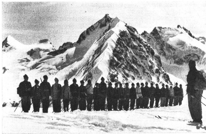
Ein Appell auf fast 4000 m Höhe auf dem Gipfel des Piz Morteratsch (im Hintergrund von links nach rechts: Piz Zupò, Piz Argient, Piz Bernina und Monte di Scerscen).

Un «appel» à près de 4000 m d'altitude, au sommet du Piz Morteratsch (à l'arrière-plan, de gauche à droite: Piz Zupò, Piz Argient, Piz Bernina et Monte di Scerscen).