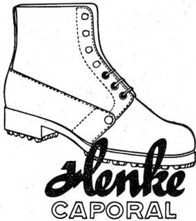
mit dem goldenen Absatznagel

trotzt schlechtem Wetter u. schlechten Wegen