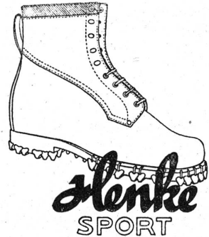
mit dem goldenen Absatznagel

trotzt schlechtem Wetter u. schlechten Wegen