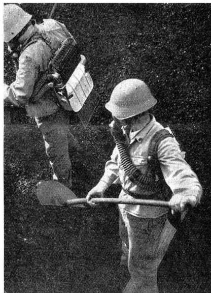
Passiver Luftschutz. Das in der Schweiz eingeführte Armeemodell eines Sauerstoffgerätes.

Gönner des Militärskiwesens haben die große Summe aufgebracht, die nötig war, um in den Bergen ein Haus zu schaffen, das total gegen 200 Mann Unterkunft gewähren wird. Der