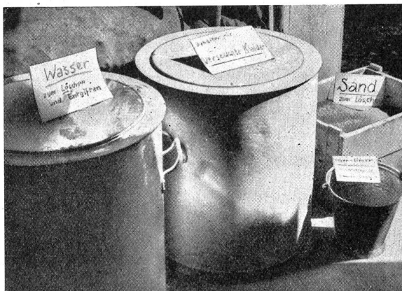
Passiver Luftschutz. Luftschutz-Raum. Der Luftschutz-Vorraum hält für die Benutzer des Schutzraumes Behälter für vergiftete Kleider, Wasser zum Löschen und Entgiften, Sand zum Löschen, Feuerlöscher und Chlorkalklösung zum Desinfizieren bereit.

Protection passive contre les gaz. Le local qui précède celui de protection proprement dit doit être pourvu, pour les besoins de ceux qui utiliseront ce dernier, de récipients pour les habits empoisonnés, l'eau servant à éteindre et désinfecter, le sable pour éteindre, d'un seau pour le feu ainsi que d'une solution de chaux et de chlore pour désinfecter.