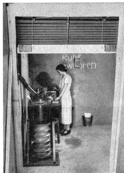
Passiver Luftschutz. Luftschutz-Raum. Blick in den Luftschutzraum von außen her. Mittels einer Jalousietüre aus imprägniertem Segeltuch-Gummistoff ist hier eine sog. Gasschleuse hergestellt, wie sie bei keinem Luftschutzraum fehlen darf. Hier spritzen sich alle Personen, die den Schutzraum benützen wollen, vor dessen Betreten mit Chlorkalklösung ab, d. h. sie desinfizieren sich gegen event. schon anhaftende Gase. Die Gasschleuse liegt zwischen dem Luftschutz-Vorraum und dem eigentlichen Luftschutzraum. Vorn im Bild links ist ein mechanischer Luftzuführapparat mit Reinigungsfilter sichtbar, mit welchem bei starker Beladung des Schutzraumes der Aufenthalt darin beliebig lang ermöglicht wird.

Protection passive contre les gaz. Local de protection vu depuis l'extérieur. Au moyen d'une porte-jalousie en toile à voile imprégnée-étouffée caoutchoutée, est installée ici une écluse à gaz comme elle ne doit manquer dans aucun local de protection contre les gaz. Ici doivent s'asperger au moyen d'une solution de chlore et de chaux, avant d'entrer dans le local même de protection, toutes les personnes qui veulent utiliser ce dernier, afin d'être désinfectées contre les gaz qui auraient déjà adhéré. L'écluse à gaz est située entre le premier local de protection et le local de protection proprement dit. On remarque à gauche, sur la présente photographie, un appareil mécanique pour la conduite de l'air, avec filtre épurateur, au moyen duquel, en cas de forte occupation du local de protection, le séjour peut y être prolongé à volonté.