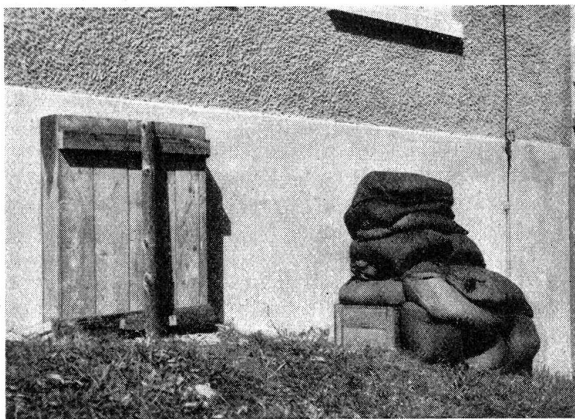
Passiver Luftschutz. Luftschutz-Raum. Die äußere Abdichtung der für Luftschutzräume vorgesehenen Keller erfolgt entweder durch eine starke Auflage von Sand- und Erdesäcken (Fenster rechts) oder aber durch einen Holzverschlag von mindestens 50 cm Tiefe, der mit fest zusammengestampfter Erde ausgefüllt wird (Fenster links).

Protection passive contre les gaz. Local de protection contre les gaz. L'obstruction extérieure de la cave prévue comme local de protection contre les gaz se fait soit par un fort empilement de sacs de sable et de terre (fenêtre de droite) soit par une cloison de bois, profonde d'au moins 50 cm, qui devra être remplie de terre pressée (fenêtre de gauche).