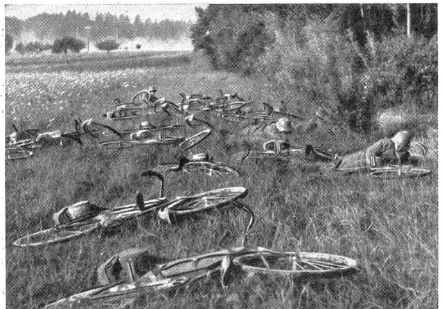
Die Aufklärungs-Abteilung. Hinter der Feuerfront einer Radfahrer-Abteilung.

große Entwicklungen, und dazu zählt sicher die Einführung der Aviatik und ihrer Abwehrwaffen, nicht so großzügig und rasch mitmachen zu können. Unsere Nachbarstaaten machen uns allerdings ein entsprechendes Nachkommen auf diesem Gebiet ganz besonders schwer, da gerade jetzt die Luftausrüstung fast in allen Staaten im riesigen Tempo und mit viel Elan betrieben wird. Da die Flugabwehrartillerie sich auf einen hohen Stand der Entwicklung und der Wirkungsmöglichkeit heraufgearbeitet hat, und sie heute unbedingt als wirkungsvoll angesehen werden muß, so dürfen wir mit der Einführung dieser Waffe nicht mehr weiter zögern. Unsere bisherige, sehr bescheidene, terrestrische Flugabwehr dürfte sich gegen die modernen Luftangriffe als zu wenig wirksam erweisen. Es ist bekannt, daß unsere militärischen Behörden die Entwicklung der Flugabwehrartillerie schon seit einiger Zeit verfolgt haben. Sie haben ebenfalls an der notwendigen Organisation des passiven Luftschutzes für die Zivilbevölkerung schon