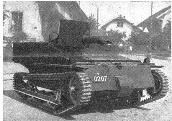
Modell eines kleinen, leichten Panzerwagens, das ebenfalls für die Aufklärungsabteilungen ausprobiert wird. Modèle d'une petite auto blindée légère qui est également mise à l'épreuve pour les détachements de reconnaissance.

Es kann mit Recht behauptet werden, daß die Treffwahrscheinlichkeit der heutigen Luftabwehrtartillerie auf einen bemerkenswert hohen Stand gebracht worden ist. Es ist absolut nicht mehr berechtigt, an einem Erfolg eines artilleristischen Luftabwehrkampfes zu zweifeln.