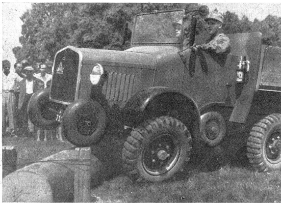
Mannschaftstransportwagen französischen Ursprunges mit einer speziellen Räderkonstruktion zum Überwinden von Hindernissen.

In einem eigens zu diesem Zwecke erstellten Hindernisgarten etwas außerhalb Langenthal, zeigte sich dann, daß diese Panzerwagen in der Lage sind, Schützengräben bis zu 1,5 m Breite und Hindernisse bis zu 1 m Höhe ohne weiteres zu überfahren, selbst ein 2 m tiefer und