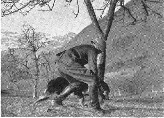
Das Tier drängt sofort energisch der Fährte nach vorwärts. Le chien avance aussitôt suivant énergiquement la piste.