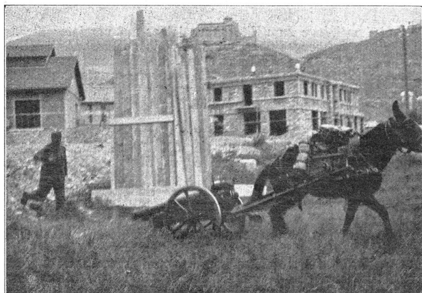
Canon de montagne 75 mm. (Modèle Bofors.) La «voiture-tube». Passage d'un remblai. On distingue les traits du premier mulet de l'attelage.

Le champ de tir en élévation est par contre considérable puisqu'il s'étend de -10° à +50°, comptés sur un terrain horizontal, bêche enfoncée, mais sans travaux spéciaux pour l'enterrer. (A suivre.)