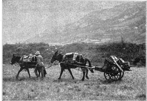
Canon de montagne 75 mm. (Modèle Bofors.) La «voiture-affût».