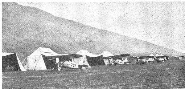
W.-K. der Jagdflieger-Kp. 15 — Auf dem Flugplatz in Biel C. R. de la cp. d'avions de chasse 15 — Aérodrome de Bienne