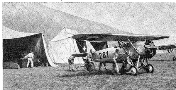
W.-K. der Jagdflieger-Kp. 15 — Ausrücken zum Starten C. R. de la cp. d'avions de chasse 15 — Mise en marche pour le départ

Escadrille militaire suisse au-dessus de la chaîne du Stockhorn Au sujet du livre «Vier Schweizer Flieger erzählen» (Quatre aviateurs suisses racontent)