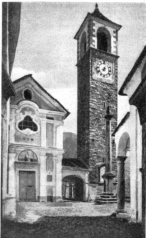
La chiesa di Mergoscia

Evviva il caro Ticino Della Patria più bel giardino, Dove è brava la gente Col cuore sincero e ardente. A. O.