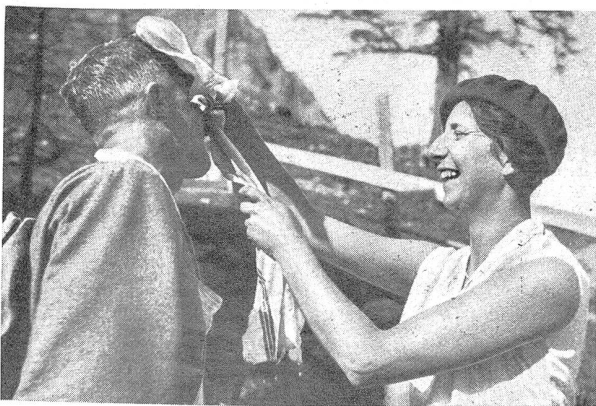
Unterwegs sind Verpflegungsposten eingerichtet, wo auch eine angenehme Waschung durch zarte Hand oder ein Schluck Wasser wieder aufzufrischen vermögen

En cours de route, où les postes de ravitaillement sont installés, un agréable lavage par une main féminine ou une gorgée d'eau redonne aussi de nouvelles forces