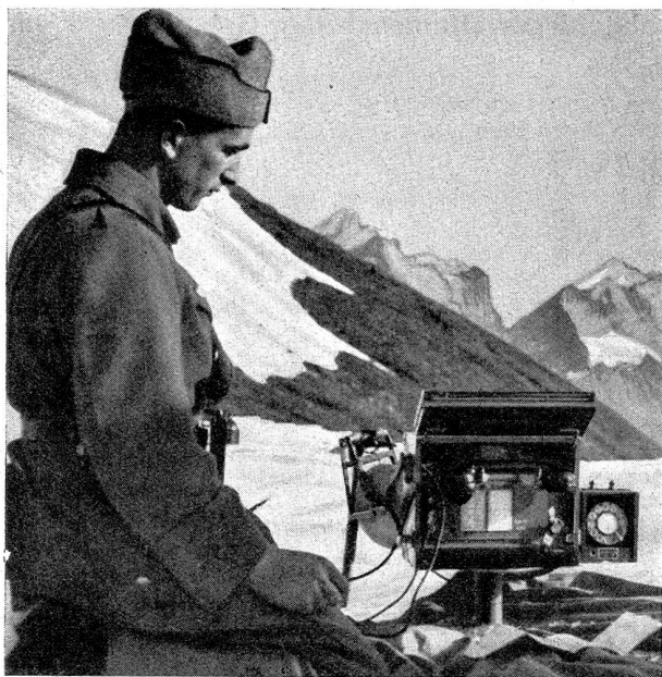
Die Geb.-Tg.-Kp. hatte bis auf die Gitzifurgen Telefonverbindungen hergestellt

La cp. télégr. mont. avait assuré les communications téléphoniques jusqu'à la «Gitzifurgen»