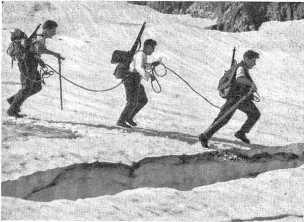
Traversieren einer Gletscherspalte auf dem Lötchengletscher Traversée d'une crevasse sur le glacier du Lötchen