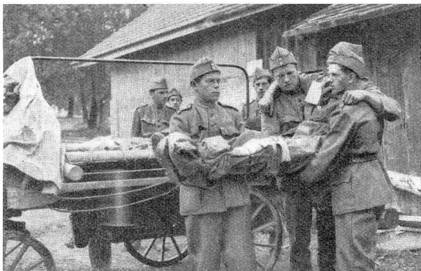
W.-K. für Nach- und Rückschub, 4. Div. 1932 Verbandplatz, Ablad vom Blessiertenwagen

C. R. pour les services opérant derrière le front, 4 e div. 1932 Place de pansement. Déchargement de la voiture pour blessés