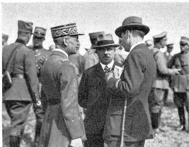
Manöver der 2. Division — Manœuvres de la 2 e division Die Bundesräte Minger und Pilet-Golaz im Gespräch mit einem französischen General

Les conseillers fédéraux Minger et Pilet-Golaz en conversation avec un général français