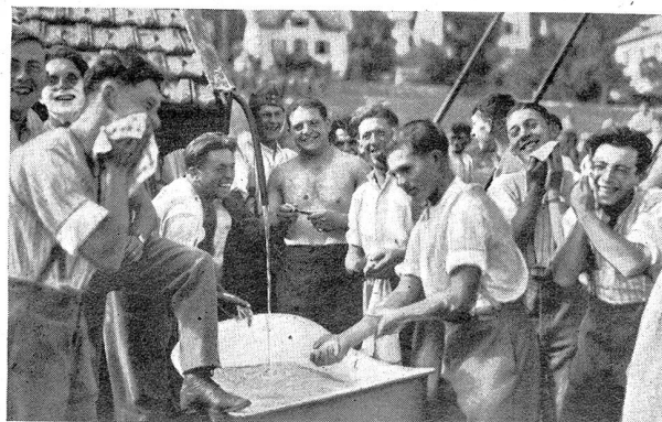
Manöver der 2. Division — Manœuvres de la 2 e division, Vor dem großen Defilee ist eine gründliche Toilette unerlässlich Avant le grand défilé il est indispensable de faire sa toilette à fond

Die vorgesehene Manöverkritik konnte zufolge Erkrankung des Manöverleiters nicht abgehalten werden. Oberstdivisionär Tissot als Chef des Schiedsrichterdienstes bot einen Rückblick über die Uebungen. Dann sprach Bundesrat Minger bemerkenswerte Worte über die besondere Lage unseres Landes, zollte der 2. Division und den Spezialtruppen für die gezeigte soldatische Haltung