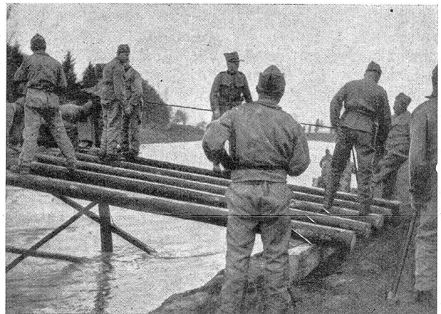
Beim Erstellen des Brückenkopfes Construction de la tête du pont

Einen weiteren Punkt möchte ich hier noch zur Sprache bringen. Es ist die noch mangelhafte innere Organisation des Kommandozuges, der dem Regimentsstab zugeteilt wird. Der für den Nachrichtendienst im Regimentsstab ausgezogene Soldat erhält einen Teil des Korpsmaterials bei der Kp., einige Kleinigkeiten erhält er direkt vom Bataillon, und wenn er dann zum Regiment kommt, werden ihm ebenfalls noch Ausrüstungsgegenstände verabfolgt. Es liegt ja selbstverständlich im Interesse der diese Gegenstände verabfolgenden Person (Feldweibel), daß sie wieder am bestimmten Platze abgegeben werden. Sehr wahrscheinlich haben aber die mit der Sache betrauten Dienststellen schlechte Erfahrungen bei den Demobilisationen gemacht und so müssen die zum Regimentsstab kommandierten Leute vor dem Verlassen der Kp. oft ihre hier gefaßten Gegenstände zum Teil wieder abgeben, eine Tatsache, die zu Be-