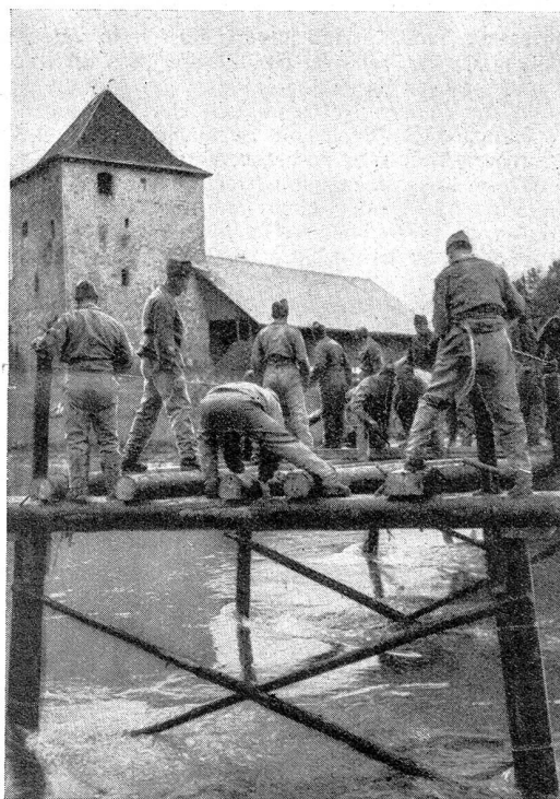
Beim Einsetzen des Tragbalkens Le placement des poutres

im Laufschrift an die einzelnen Arbeitsplätze: Der Ladetrupp zu dem Lager schwerer eichener Planken, der Bocktrupp zu den aus wuchtigen Tannenstämmen solide zusammengefügt Brückböcken, der Wagentrupp hinüber zu dem eigenartigen Bauwagen, einem Riesenhebel auf Rädern. Jedes überflüssige Wort wird vermieden, alles geht auf Zeichen und Winke, denn nicht nur rasch, sondern auch möglichst lautlos soll die Brücke gebaut werden. Am abgesteckten Brückenkopf wird der erste Bock von Hand aufgerichtet, der Bauwagen fährt vor, hebt mit seinem Riesenhebel den Bock in die Höhe, fährt weiter vor, bis der Bock gute 4 Meter über das Ufer hinaus auf das Wasser hinunterrat; ein Zeichen des Unteroffiziers auf dem Wagen, der Hebel schnellst hinten in die Höhe und der Bock saust vorne mit Wucht auf den Flußboden hinunter. Er «sitzt» richtig und fest, über die beiden mitausgelegten äußern Tragbalken balancieren die Leute des Bautrupps hinaus, weitere Tragbalken werden ihnen langsam zugeschoben und mit den Verbindungszapfen eingesetzt, mit Seil und Eisenklam-