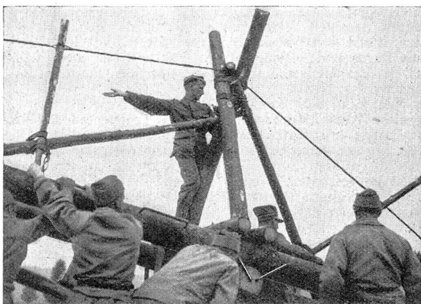
Ein Unteroffizier dirigiert vom Drehpunkt des Wagens aus die mit dem Hebel auszuführenden Bewegungen

Un sous-officier dirige depuis le point tournant du chariot les manœuvres qui doivent être faites avec le levier