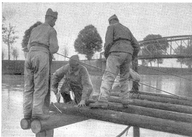
Der Bock ist ausgelegt. Der Bautrupps setzt die Tragbalken ein

Ein grauer, naßkalter Tag. Vom nahegelegenen Glarnerland her schleichen die Nebelwolken tief unten an den Berghängen entlang, schier lautlos ziehen die Wasserfluten vom Walensee her durch den Linthkanal hinunter nach dem Zürichsee. Nichts stört die Ruhe der Landschaft. Und doch herrscht drüben beim malerischen Schloßurm Grinau ein seltsam reger Betrieb. Mit dem Glockenschlag 9 Uhr, den der Wind von Uznach herüberträgt, treten die 280 Mann des Landwehr-Sappeur-Bataillons 15 in zwei Gliedern an, ein Hauptmann teilt die verschiedenen Arbeitsgruppen ein und schon geht es