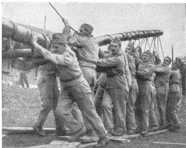
Der Hebel wird heruntergezogen; dadurch wird am andern Ende des Wagens der Brückenkopf gehoben Le levier est abaissé. A l'autre bout du chariot, le chevalet est de la sorte élevé

Der Wehrmann, der im Kriegsfall und bei innern Unruhen aus Familie und Beruf gerissen wird, der sich mit seinem eigenen Leibe für die Unabhängigkeit seines Vaterlandes und für die Aufrechterhaltung der Ruhe und Ordnung einsetzen muß, der sich der Bedeutung unserer Armee, der demokratischen Freiheiten bewußt ist, der weiß, daß nur der Frieden eine gedeihliche Fortentwicklung und eine sichere Existenz bieten kann, er ist der größte Freund aller Friedensbestrebungen. Aber Frieden nennen wir einen Zustand, in dem aufgebaut und nicht niedergerissen wird. Mit Menschen, die Armee und Vaterland, Heimat und Familie in den Schmutz ziehen, setzt sich der Wehrmann nicht an den Verhandlungstisch und verweigert solchen Aposteln der « Diktatur des Proletariates » die Niederlassung in seinem Heimatland. Ehrliche Friedensfreunde sind uns stets willkommen und wir reichen ihnen die Hand zum Bunde, Vaterlandsverräter und Antimilitaristen aus Demagogie