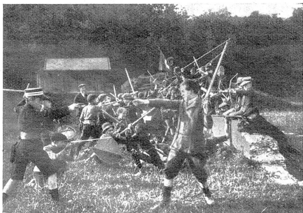
Jugend von dazumal — Im heißen Nahkampf Jeunesse d'autrefois — Un chaud corps à corps

Desselben Tags zierte um drei Uhr mitteleuropäischer Zeitrechnung ein daumendickes, überaus schwungvolles Meerrohr das schulmeisterliche Pult, und die einleitenden Erklärungen zur Ausstellung dieses abschreckenden Strafinstrumentes (viel später begegnete ich einer ähnlichen Erscheinung unter dem Titel der Generalprävention) galten einer absonderlichen Lümmelbande. Darunter verstanden wir natürlich uns. — Von da ab