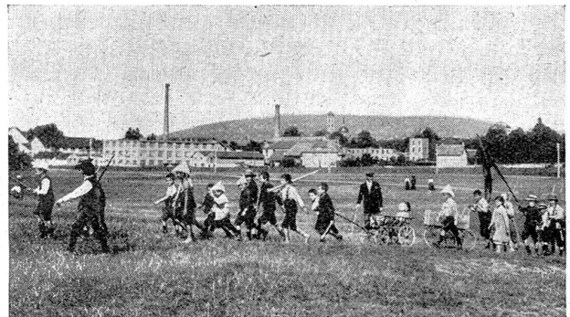
Jugend von dazumal — Der Aufmarsch der Kleinen auf der Wiedikon Allmend in Zürich Jeunesse d'autrefois — La marche des petits sur l'Allmend de Wiedikon à Zurich

Die Teilung hatte ihre bösen Folgen. Sie wirkte wie die Erbsünde. Neben der wachsenden Autoritätslosigkeit lernten wir von da an auch eine Art Klassenhaß kennen. Man hatte uns das vorgemacht, indem man Klassenunterschiede züchtete. Denn wir wurden nicht etwa nach Name oder Schulbankreihe in zwei Hälften geteilt. Ganz abgesehen davon, daß sich Bubenfreundschaften nicht nach Hosen und Krawatten, noch weniger nach