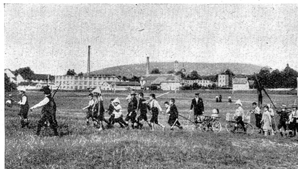
Jugend von dazumal — Der Aufmarsch der Kleinen auf der Wiedikon Allmend in Zürich Jeunesse d'autrefois — La marche des petits sur l'Allmend de Wiedikon à Zurich

Die Teilung hatte ihre bösen Folgen. Sie wirkte wie die Erbsünde. Neben der wachsenden Autoritätslosigkeit lernten wir von da an auch eine Art Klassenhaß kennen. Man hatte uns das vorgemacht, indem man Klassenunterschiede züchtete. Denn wir wurden nicht etwa nach Name oder Schulbankreihe in zwei Hälften geteilt. Ganz abgesehen davon, daß sich Bubenfreundschaften nicht nach Hosen und Krawatten, noch weniger nach