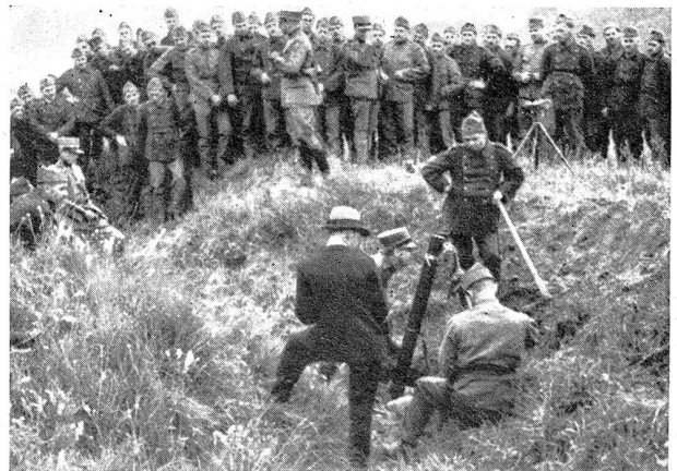
Bild 9. Demonstrationsschießen mit Minenwerfer Photo 9. Tirs de démonstration avec lance-mines