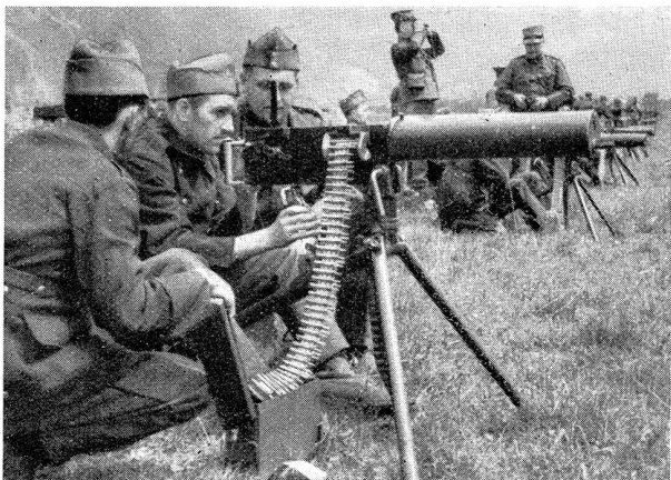
Bild 6. Landsturm-Mitr. beim Mg.-Schießen Photo 6. Mitrailleurs du landsturm effectuant des tirs à la mitrailleuse

sind 233 Millionen Mark mehr als 1932, ungerechnet die anderweitig untergebrachten Wehrausgaben.