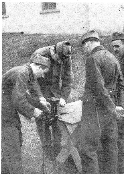
Bild 7. Beim Gurtenfüllen Photo 7. Le remplissage des bandes

Was können wir einem solchen Angriff entgegensetzen? Wir haben wohl als westliche Begrenzung des Rheintals