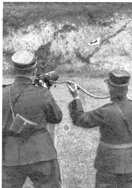
Bild 5. Schießen auf bewegliche Flugzeugziele auf dem Schießplatz Wallenstadt. Mittels eines Haspels wird die Flugzeugscheibe mit beträchtlicher Geschwindigkeit auf eine Distanz von über 100 m vor dem Maschinengewehr vorbeigezogen. Der Schiessende visiert nach dem bei Bild 4 angeführten System das Ziel an und feuert, ohne jedoch dem Flugzeug mit der Visierlinie zu folgen. Gleich die erste Schießübung ergab ein Resultat von vier Treffern im schwarzen Flugzeug selbst und sieben Treffern im weißen Teil der Scheibe.

(Korr.) Deutschlands Rüstungsausgaben beliefen sich in der Zeit von 1931 bis 1933 jährlich auf rund 657 Millionen Mark, wovon 474 Millionen auf das Reichsheer entfielen und 183 Millionen auf die Marine. Der Voranschlag für 1934 aber sieht plötzlich bedeutend größere Beträge vor. Für die Landarmee sind diesmal 574 Millionen für laufende, plus 80 Millionen für einmalige Ausgaben eingesetzt. Bei der Marine sind vorgesehen 128 Millionen für laufende und 108 Millionen für einmalige Ausgaben. (Kiellegung neuer Kriegsschiffe.) Heer und Marine verschlingen somit zusammen 890 Millionen, das