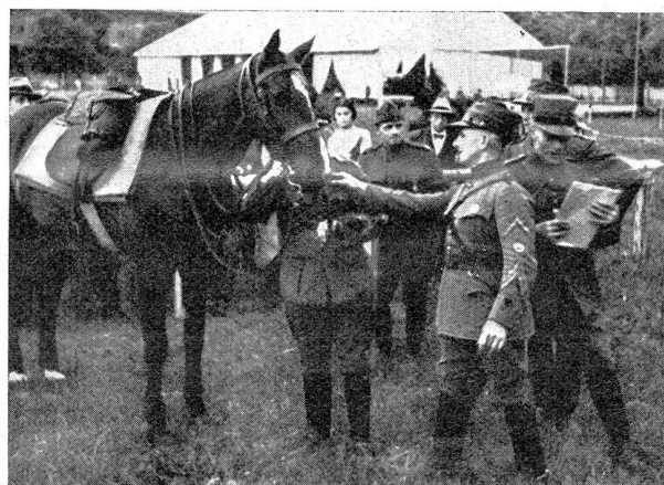
Beim Nachprüfen der Sattelung und Zäumung Le contrôle du sellage et du bridage