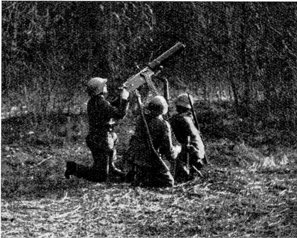
Bild 12. Die Mg. müssen vollkommen schußbereit sein, sollen sie mit ihrem Feuer nicht zu spät kommen

Photo 12. Les mitrailleuses doivent être absolument prêtes à tirer si, en cas d'attaque, elles ne veulent pas arriver trop tard avec leur feu