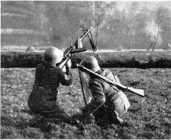
Bild 10. Auch der Hag muß als Unterlage dienen Photo 10. La barrière doit aussi servir d'appui

lichen, militärischen und polizeieigenen Telephonlinien trug viel zum guten Gelingen aller Aktionen bei. Durch den Einsatz der verhältnismäßig schwachen Teile des Bundesheeres — es wurden auch die Offizierschüler und Telegraphentruppen in das Feuer geführt — war es doch gelungen, auch in Wien den Aufstand niederzuschlagen. Die freiwilligen Helfer der Schutzkorps sicherten der Regierung die Handlungsfreiheit. Leider erforderten die Straßenkämpfe schwere Verluste. Trotz besserer Führung, überlegener Bewaffnung und Ausrüstung verlor das Bundesheer 2 Offiziere und 31 Mann an Toten und über 120 an Verwundeten, wovon noch 70 an schweren Wunden liden.