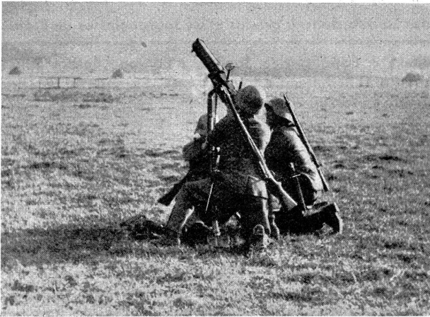
Bild 7. Mg. auf der normalen Lafette mit Aufsatz für Fliegerschießen Photo 7. Mitrailleuse sur trépied normal avec accessoires pour tir contre avion

schließlich die Macht für die Partei zu erringen. Dem entsprechend beginnen auch gleich am 12. Februar die Kämpfe in Wien, Linz, Graz, Steyr und im obersteirischen und weststeirischen Industriegebiet. Um militärische Zuschübe gegen das Kohlenrevier Thomasroith-Wolfsegg (Oberösterreich) zu verhindern, wurde seitens der Schutzbündler auch der bedeutende Hausrucktunnel verbarrikadiert und abgesperrt — ja, sie hatten es dort selbst sogar mit Sprengungen versucht.