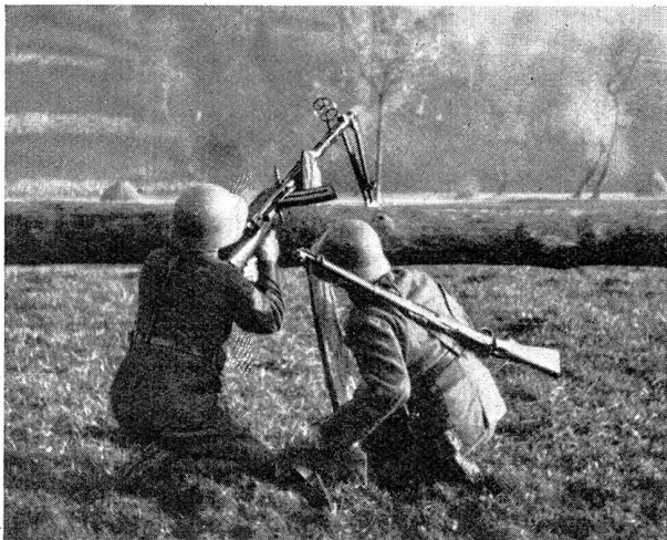
Bild 10. Auch der Hag muß als Unterlage dienen Photo 10. La barrière doit aussi servir d'appui

lichen, militärischen und polizeieigenen Telephonlinien trug viel zum guten Gelingen aller Aktionen bei. Durch den Einsatz der verhältnismäßig schwachen Teile des Bundesheeres — es wurden auch die Offizierschüler und Telegraphentruppen in das Feuer geführt — war es doch gelungen, auch in Wien den Aufstand niederzuschlagen. Die freiwilligen Helfer der Schutzkorps sicherten der Regierung die Handlungsfreiheit. Leider erforderten die Straßenkämpfe schwere Verluste. Trotz besserer Führung, überlegener Bewaffnung und Ausrüstung verlor das Bundesheer 2 Offiziere und 31 Mann an Toten und über 120 an Verwundeten, wovon noch 70 an schweren Wunden liden.