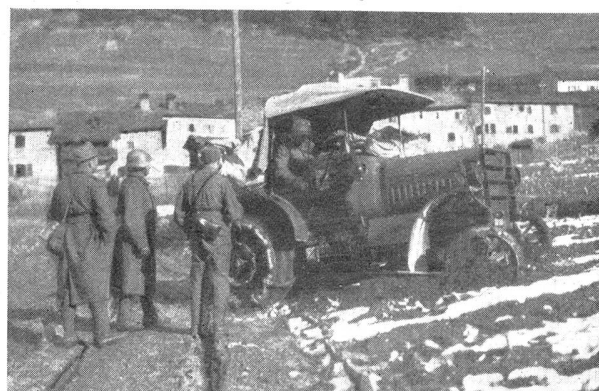
Festgefahrner Traktor — Tracteur embourbé

Une fois que la batterie est arrivée à proximité de