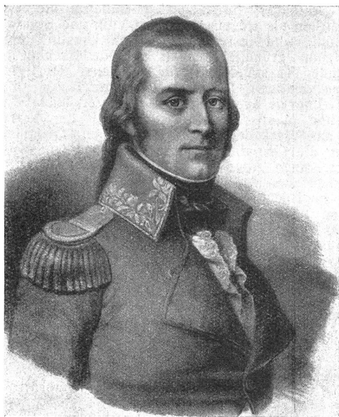
Colonel Aloys de Reding

composer un chant de l'Iliade ou une tragédie de Corneille? »