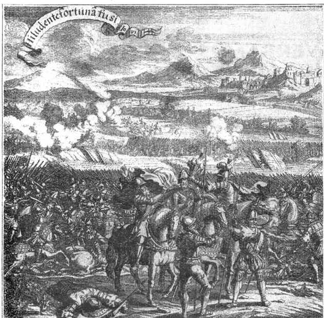
La Bataille de Novare

En outre, de très belles gravures hors-texte illustrent richement cet ouvrage qui, à l'époque où l'en en vient à oublier quelque peu ce que notre génération doit aux