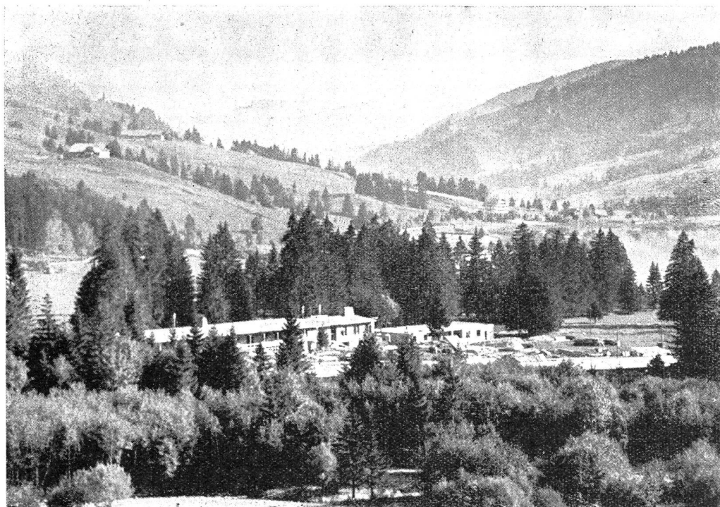
Das neue Militärlager am Schwarzsee