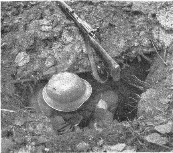
Der Gebrauch des kleinen Schanzwerkzeuges bei der Infanterie Bild 7: Schützennest für stehenden Schützen, bietet ihm während Feuerpausen Sitzgelegenheit. Zur Deckung gegen Splitter könnte das Schützenloch mit Bohlen überdeckt werden.

L'emploi des outils de pionnier dans l'infanterie Photo 7: Nid de tirailleur, pour tireur debout permettant de s'asseoir pendant les arrêts du feu. Pour protéger l'homme contre les éclats, le trou peut être recouvert avec des madriers