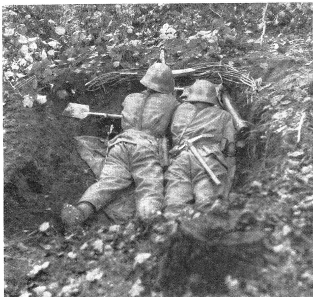
Der Gebrauch des kleinen Schanzwerkzeuges bei der Infanterie Bild 9: Lmg.-Nest für 2 Mann, Schießender und Wechsellaufträger. L'emploi des outils de pionnier dans l'infanterie Photo 9: Nid de F.M. pour 2 hommes. Tireur et porteur du canon de rechange.

Einmal aber hörten diese Linien wieder auf, dann kam der traditionelle Blick nach oben und schon erfönte das: Glänzend, einfach herrlich! Dem andern, der nicht sprechen mag, dem leuchten aber auch in stiller Freude seine Augen. Aber alle danken Gott für die wunderbaren Stunden, die sie in dieser freien Alpenwelt verleben durften, und zugleich stieg tiefes Mitleid zu Tale, zu jenen, die unter dieser grauen Nebeldecke dem Alltag nicht zu entrinnen vermochten.