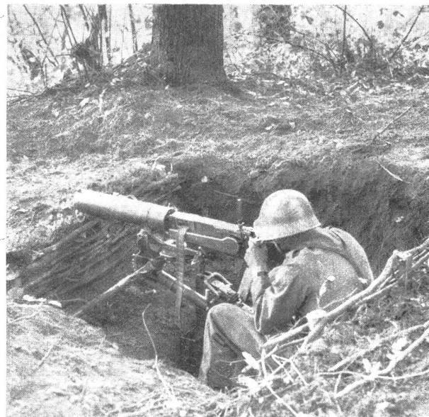
Der Gebrauch des kleinen Schanzwerkzeuges bei der Infanterie Bild 10: Maschinengewehrnest für sitzenden Schützen. Brustwehr und Rückwand des Sitzes sind mit Strauchwerk verkleidet. In den Seitenwänden r. u. l. könnten Munitionsdeckungen geschaffen werden.

Der vom solothurnischen Kantonalverband dem Unteroffiziersverein Solothurn zur Durchführung übertragene erste kantonale Militär-Skipatrouillenlauf findet Sonntag den 5. März 1933 auf dem Weissenstein bei Solothurn statt. Die Konkurrenz steht den von den Verbandssektionen und militärischen Einheiten gebildeten Patrouillengruppen offen. Zur Veranstaltung sind die solothurnischen kantonalen Unteroffiziersvereine sowie