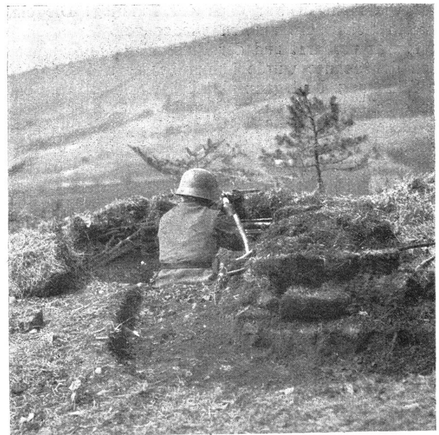
Der Gebrauch des kleinen Schanzwerkzeuges bei der Infanterie Bild 8: Lmg.-Nest für sitzenden Schützen. Brustwehr mit Strauchwerk verkleidet. Im Vordergrund ein Kriechgraben zum nächsten Schützenloch führend.

Wieder einmal hat es angefangen, dieses geheimnisvolle Drängen nach Sonne, Luft und Schnee. Und wieder sind die winzigen Menschlein kühn geworden und haben sich gestattet, die stille Einsamkeit der Berge zu stören, um durch ihre schneebedeckten Weiden jene wunderbaren Linien zu ziehen.