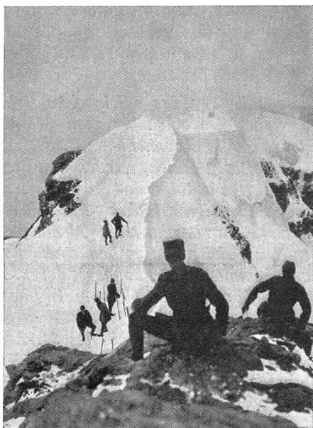
Auf dem Gipfel der Sphinx (Jungfrauoch). Schnee und heftiger Wind machen die Gipfelrast recht unangenehm

Aber nicht allein der Firnenzauber der Alpen, die grünen Weiden und Täler mit den opalblauen Seen und den schmucken, von klaren Flußläufen umspülten Städtchen, machen unser Heimatland so begehrenswert, sondern ebenso sehr auch unsere althergebrachten Sitten und Bräuche, unsere bewährten, vorbildlichen Institutionen, und vor allem unsere heißerkämpfte Freiheit und Unabhängigkeit.