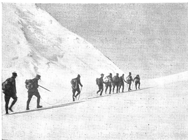
Bald ist die Lötschenlücke erreicht La « Lötschenlücke » va être atteinte

Wer anlässlich der Genfer Vorfälle die Soldaten der Ordnungstruppen zur Gehorsamsverweigerung aufgefor-