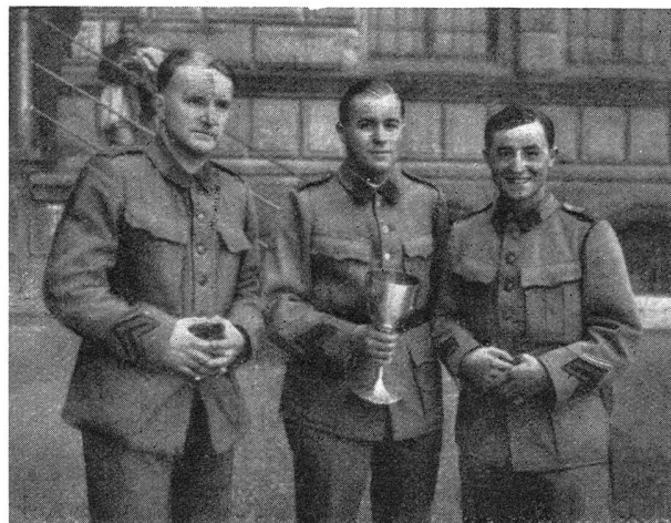
Gewinner des Wanderbechers: Rdf.-Kp. 15 La compagnie de cycl. 15 gagne la coupe-challenge