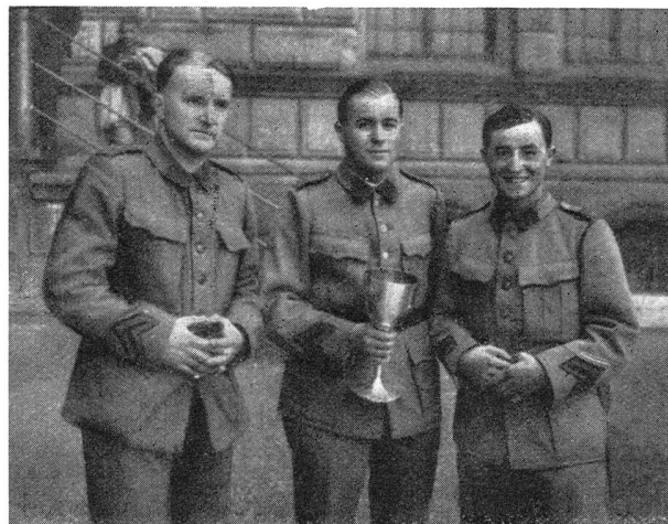
Gewinner des Wanderbechers: Rdf.-Kp 15 La compagnie de cycl. 15 gagne la coupe-challenge