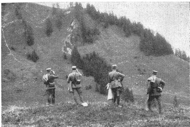
Der Korps-Kdt. und der Div.-Kdt. verfolgen die Bewegung der Truppe bei Kadhaus

Le cdt. de corps et le cdt. de div. suivent le mouvement des troupes près de Kadhaus Bild 6