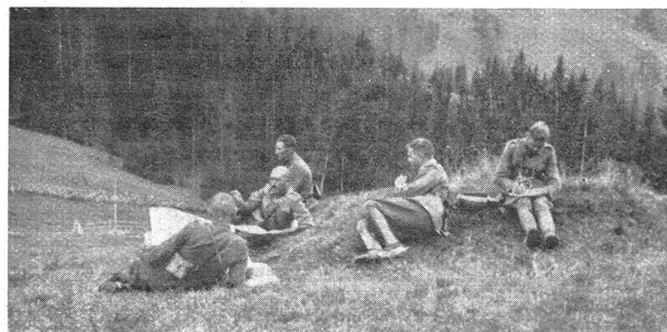
Das Kdo. des Geb.-I. R. 18 in den Manövern an der Arbeit Le cdt. du R.-I. mont. 18 au travail pendant les manœuvres

Die Verpflegung für den 22. September mußte am 21. die Distanz von zwei guten Tagmärschen von Habkern bis Heidbühl und Blapbach zurücklegen. Am frühen Morgen wurde der Grünenbergpaß mit den 18 Fourgons der Geb.-Vpf.-Kp. III/3 ohne Vorspann in Angriff genommen. Gegen 17.00 erreichten sie den Fassungsplatz Schangnau, wo die Verpflegung auf den Fassungsbaumtrain des R. 17 gebastet wurde. Da aber feindliche Flieger den Fassungsplatz mit Bomben belegten, wurde der Fassungsbaumtrain eines Bat. « außer Gefecht » gesetzt, und es mußten die mit den Hilfsbastsätteln versehenen Fourgonpferde des R. zu Hilfe gezogen werden. Trotz dieser durch Gelände, Witterung und feindliche Einwirkung verursachten Hindernisse und Hemmungen