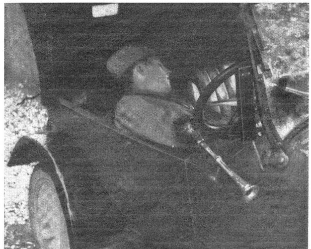
Die Chauffeure haben während der Manöver strengen Dienst Les chauffeurs ont un service pénible pendant les manœuvres

Alle Anzeichen deuten darauf hin, daß um das Militärbudget 1933 in der diesjährigen Dezembersession der eidgenössischen Räte ein Großkampf entbrennen wird. Der Chef des Eidg. Militärdepartements legt für 1933 ein Budget in der Höhe von Fr. 94,366,000.— vor, gegenüber 96,8 Millionen in diesem Jahr. Die Einsparung von 2,5 Millionen Franken ist erzielt worden durch die Abschaffung der Rationspferde für die Truppenkommandanten und Generalstabsoffiziere und die Einschränkung des Inspektionsrechtes für Truppenkommandanten und Heereseinheitskommandanten (Fr. 90,000), dadurch, daß im Jahre 1933 ein Jahrgang weniger zum Wiederholungskurs einrückt als gesetzlich vorgeschrieben ist (1,5 Millionen Franken) und durch Verkürzung der obligatorischen Schießübungen von 5 auf 4 (220,000 Fr.). Die sozialdemokratische Fraktion der Bundesversammlung aber ist nicht befriedigt von diesem sichtbaren Zeichen des guten Willens zum Sparen. Sie will aufs Ganze und daher hat sie bei Schluß der letzten Session der Räte eine Motion eingereicht, durch die sie für 1933 und 1934 eine Kürzung des Militärbudgets um je 30 Millionen Franken fordert. Eine solch gewaltige Reduktion aber würde nicht mehr und nicht weniger bedeuten als Verunmöglichung des Militärbetriebes. Da man einer Initiative auf vollständigen Abbau der Armee keinen Erfolg zutraut, versucht man's auf diese Weise. Es hängt von der Haltung der bürgerlichen Ratsmitglieder ab, ob dem Vorstoß von links Erfolg beschieden sein wird oder nicht.