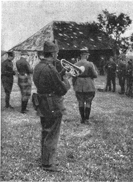
Gefechtsabbruch — Cessez le feu