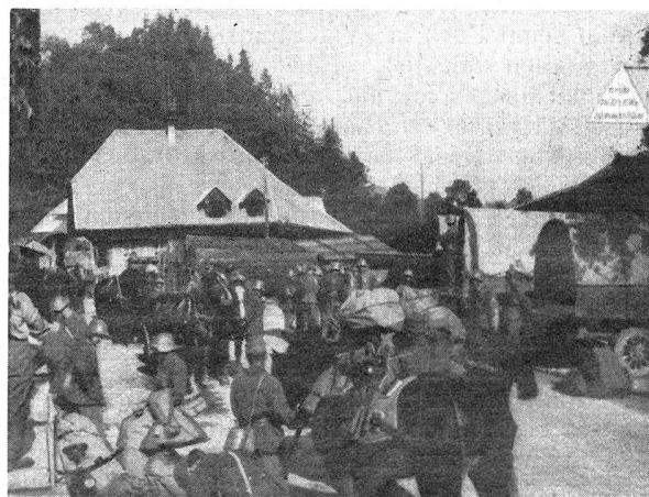
W.-K. der Geb.-I.-Br. 9 — C. R. de la Br. I. mont. 9 Fassungsplatz Eggiwil — La place de ravitaillement d'Eggiwil

Eingeleitet wurde die Schlacht durch ein großes Reitergefecht bei Liebertwolkwitz am 14. Oktober, das