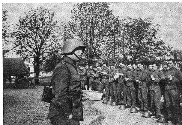
Frd. Mitr.-Kp. 14 — La cp. att. mitr. 14 Der Herr Hauptmann orientiert die Mannschaft über die taktische Lage Le capitaine oriente ses hommes sur la situation tactique

Im Anschluß an diese längsterwartete « Neuigkeit » können wir es uns nicht versagen, — trotz der vorgerückten Zeit, — den Lesern des « Schweizer Soldat » einiges zur erzählen aus dem diesjährigen W.-K. der Frd. Mitr.-Abt. 5, im besondern von den Erlebnissen der Frd. Mitr.-Kp. 14.