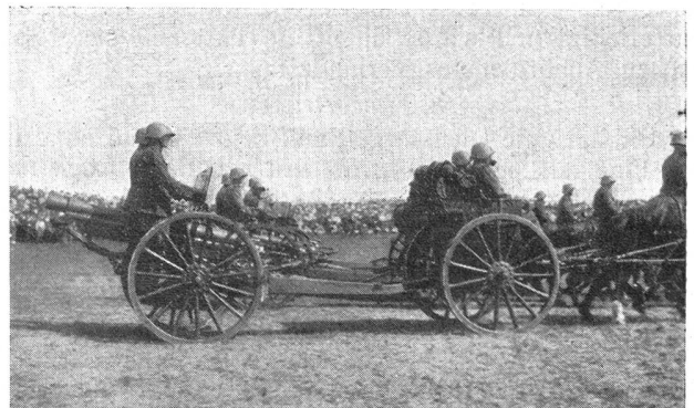
Defilee der 6. Division — Défilé de la 6 e division Die Feldartillerie — L'artillerie de campagne

Es ist wohl richtig, daß im Manöver, wo der Bewe-