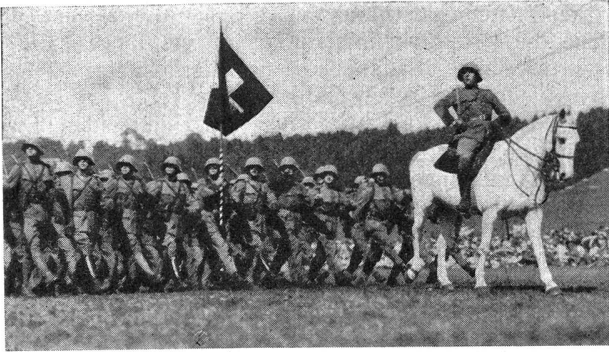
Defilee der 6. Division — Défilé de la 6 e division Spitze eines Bataillons — La tête d'un bataillon