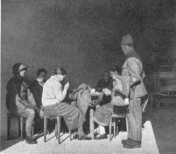
W.-K. des I.-R. 15 — C. R. du R. I. 15 Die Gradabzeichen der „Höhern“ werden aufgenäht ... puis les galons des „supérieurs“ sont cousus

auch mit Heu, ist Vorbedingung für eine dauernde Verwendbarkeit der Kavallerie.