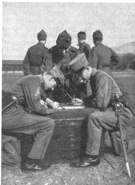
W.-K. des I.-R. 15 — C. R. du R. I. 15

Trotzdem man aus Parteien und allen möglichen Verbänden heraus offen und versteckt versucht, den berechtigten Wert unserer Landesverteidigung abzuerkennen und als nicht mehr zeitgemäß zu taxieren, so üben bei unserm Volke zum Leidwesen der Antimilitaristen