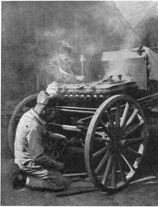
W.-K. des I.-R. 15 — C. R. du R. I. 15 Das erste „Bankett“ wird zubereitet Le premier „banquet“ est en préparation

die beiden Wörter « Manöver » und « Defilee » auch heute noch eine ungeschmälerte Anziehungskraft aus. Wer in den letzten paar Jahren die riesigen Zuschauermengen an den Defilees gesehen oder hiervon gelesen hat, wird nicht das Gegenteil behaupten wollen. Der verstorbene Redaktor Hans Schmid schrieb letztes Jahr anlässlich des Defilees der 5. Division in der « Thurgauer Zeitung » u. a. folgendes: « Der Name ‚Defilee‘, der aus dem Volksmund und nicht aus dem militärischen Sprachgebrauch hervorgegangen ist, gilt nun und ist offiziell geworden. Militärisch gesprochen bedeutet ja ‚Defilee‘ etwas ganz anderes, und die Eidgenossen romanischer Zungen kennen das ‚Defilee‘ für den Schlußakt militärischer Manöver nicht, die Welschen sagen ‚Revue‘ und die Tessiner ‚Sfilata‘. Daß sich der populäre Ausdruck in der deutschen Schweiz durchgesetzt hat, beweist mehr als alles andere, daß wir es da mit einer volkstümlichen Sache zu tun haben, und es soll deshalb an diesem ‚Defilee‘ nicht gezupft und gerüttelt werden; das Volk hat schließlich das Recht, etwas, das seine Sache ist, so zu benamen, wie es ihm in den Schnabel paßt. Und daß der Schlußakt eines Divisionsmanövers in der Schweiz eine Sache des Volkes ist, hat sich je und je gezeigt. »