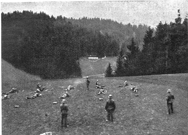
W.-K. des I.-R. 15 — C. R. du R. I. 15 Auf dem Schießplatz — Sur la place de tir

Rückzug gegen Graltshausen anzutreten. Bei der Kritik hieß es, daß es aufgefallen sei, daß wie gestern die Landwehr, so heute die 13. Brigade reine Defensivaufgaben offensiv zu lösen versucht habe.