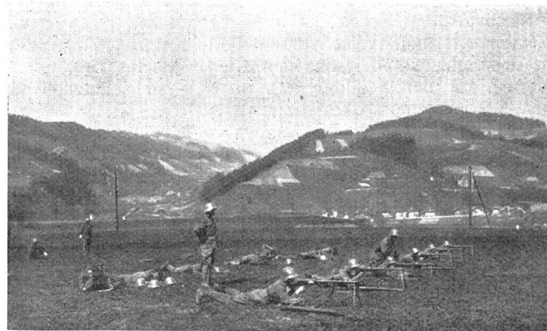
W.-K. des I.-R. 15 — C. R. du R. I. 15 Eng.-Schießen — Tirs au F. M.

Von diesen Schützen gingen eine Anzahl — schon früher preisgekrönt und Veteranen — ohne Hut umher. Aber gleich Schülern, die von einer Preisverteilung zurückkehren, marschierten sie erhobenen Hauptes, die Stirne bedeckt mit einem leuchtenden Lorbeerkranz, mit roten oder goldenen Beeren und mit blau-rot-weißen, silberne Aufschriften enthaltenden Bändern — den Farben von Dübendorf —, die ihnen auf den Nacken fielen. Andere, die in das Band ihres grünen oder grauen Hutes eine Karte mit dem Bild eines knienden Schützen