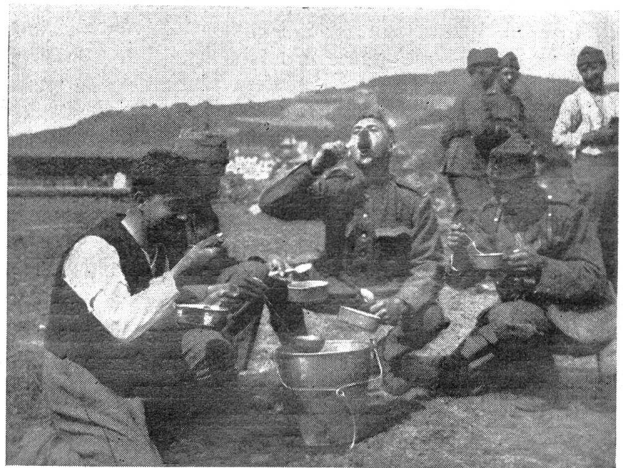
W.-K. des I.-R. 15 — C. R. du R.-I. 15 Soldaten haben schon am Einrückungstag einen gesegneten Appetit Le jour de l'entrée au service déjà, les soldats ont un appétit qui compte

Für den zweiten Manövertag gab die Leitung neue Suppositionen und Befehle aus, nach welchen die 13. Brigade sich auf der Linie Andhausen-Birwinken-Klarsreute zurückziehen hatte, um den linken Flügel des roten Armeekorps zu sichern, das supponiert bei Berg-Kehlhof stand, bis Verstärkungen am 6. Oktober eintrafen und die rote Partei wieder zur Offensive übergehen konnte. Bei jenen heißen Kämpfen um Klarsreute entstand ein wildschönes Schlachtenbild. Zwei Kompanien vom Schützenbataillon 7 deckten die bei Klarsreute abbauenden Batterien, von denen zuletzt nur noch ein einziges Geschütz drauflos donnerte, um dann ebenfalls den