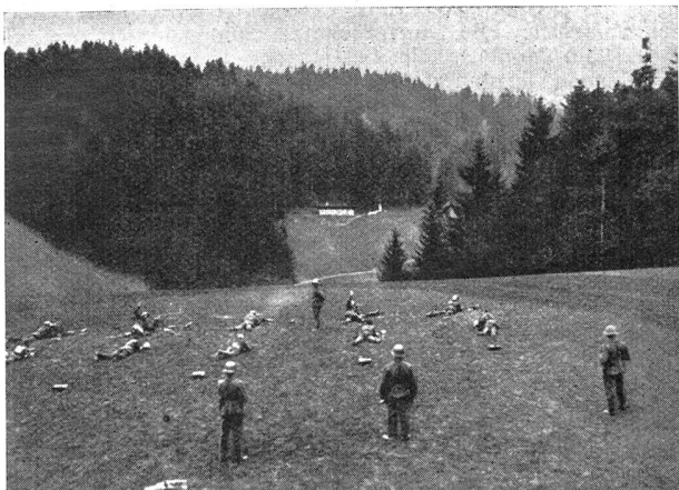
W.-K. des I.-R. 15 — C. R. du R. I. 15 Auf dem Schießplatz — Sur la place de tir

Rückzug gegen Graltshausen anzutreten. Bei der Kritik hieß es, daß es aufgefallen sei, daß wie gestern die Landwehr, so heute die 13. Brigade reine Defensivaufgaben offensiv zu lösen versucht habe.