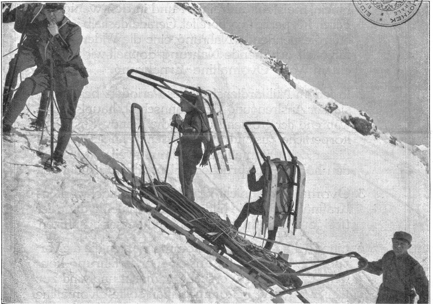
Bild II. Rettungsschlitten System Hunger, vorn montiert, hinten demontiert, im Aufstieg