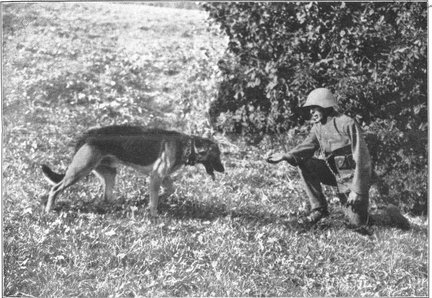
Die Kriegshunde der 2. Division Ankunft eines Hundes auf dem Kommandoposten

Offizielles Organ des Schweiz. Unteroffiziers-Verbandes