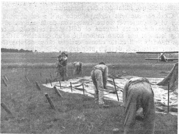
Zeltbau; Ausbreiten des Zelttuches. Montage d'une tente. Dépliage de la toile de la tente.

Die ausgedehntesten Flottenmanöver , die Japan je erlebt hat, haben am 31. Juli im westlichen Pazifischen Ozean begonnen. An den Uebungen, die bis zum 25. August dauern sollen, nehmen 150 Kriegsschiffe und zahlreiche Marine-Flugzeuggeschwader teil. Für das nächste Jahr ist der Bau von 110 Wasserflugzeugen, die Modernisierung von 4 Kreuzern, die