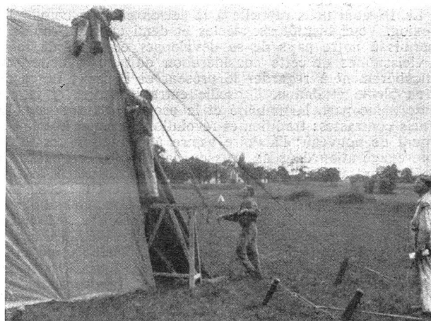
Zeltbau; Zuknöpfen des fertiggestellten Zelttes. — Montage d'une tente. Fermeture de la tente complètement terminée.

Das größte Flottenbauprogramm in der Geschichte der amerikanischen Marine wird einer Mitteilung des Marineministers Swanson zufolge in Kürze mit einem Kostenaufwand von