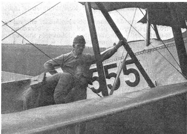
Montage eines Flugzeuges. Kontrolle des Kampfrichters. — Montage d'un avion. Contrôle par un membre du jury.