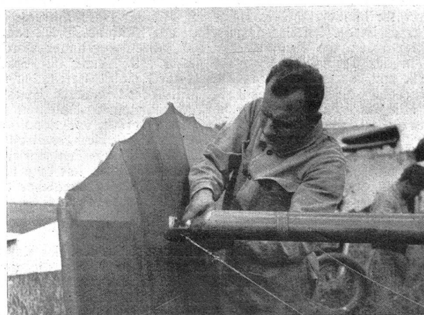
Vollständige Demontage eines Tragflächenpaares. Démontage complet d'une paire d'ailes.

Zunächst kommt man in Versuchung, über diesen prachtvollen Reifall des Kämpfers weidlich zu lachen, der die vom Unteroffiziersverein Hinterthurgau mit seinem Uebungsleiter Herrn Hptm. Weibel durchgeführten Vorübungen für die Schweiz. Unteroffizierstage in Genf mit Bürgerkriegsvorbereitungen verwechselt. Es tut einem « klassenbewußten » Fanatiker natürlich in der Seele weh, sehen zu müssen, wie es noch « Verräter » im arbeitenden Volk gibt, die sich dazu hergeben, in der gehäßten feldgrauen Uniform freiwillige Arbeit zu leisten. Die Feststellung des Kämpfers, es handle sich vorzugsweise um Arbeiter aus dem Betriebe des Herrn Weibel, ist erlogen. Dies war den Zuträgern der Schauerzmär aus dem hintern Thurgau und wohl auch dem geistigen Leiter des revolutionären Hetzblattes bekannt. Sie mußten auch wissen, was es mit diesen militärischen Uebungen für eine Bewandnis hatte. Der Kämpfer hat jedoch einmal mehr die Gelegenheit benützen wollen, die lesende Arbeiterschaft aufzuhetzen gegen unser Militär und unsere Offiziere und Unteroffiziere, die der Bürgerkriegsvorbereitungen verdächtigt werden. Wenn wir auch der Auffassung sind, daß unsere Arbeiter in der großen Mehrzahl intelligent genug sind, um die Lächerlichkeit