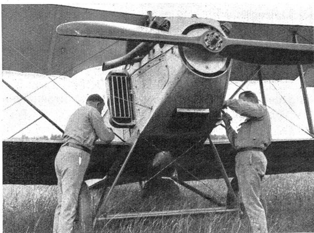
S. U. T. Genf. Wettübungen der Fliegertruppe: Demontage eines Flugzeuges. Nach dem Kommando: „An die Arbeit!“ werden die verschiedenen Kabel der Tragflächen gelöst. — J. S. S. O. Genève. Exercices pour pionniers-aviateurs: Démontage d'un avion. Après le commandement « au travail! » on détache les câbles-porteurs des ailes.