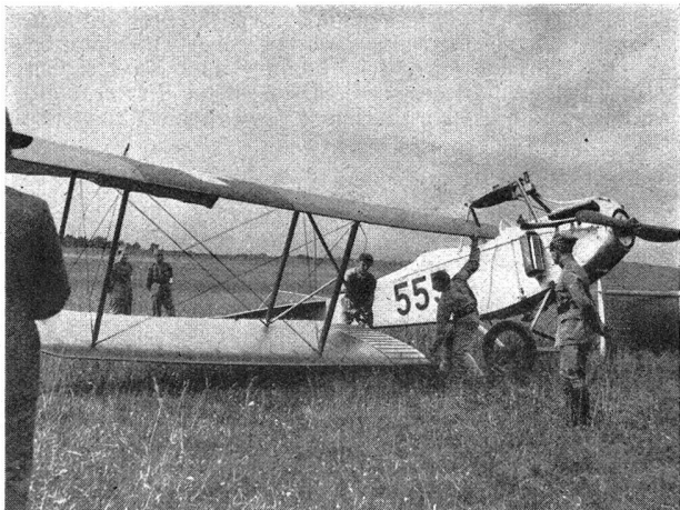
Zweites Tragflächenpaar wird ausgehoben. Démontage de la deuxième paire d'ailes.