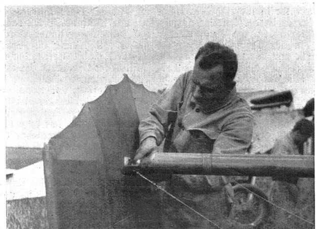
Vollständige Demontage eines Tragflächenpaares. Démontage complet d'une paire d'ailes.

Zunächst kommt man in Versuchung, über diesen prachtvollen Reifall des Kämpfers weidlich zu lachen, der die vom Unteroffiziersverein Hinterthurgau mit seinem Uebungsleiter Herrn Hptm. Weibel durchgeführten Vorübungen für die Schweiz. Unteroffizierstage in Genf mit Bürgerkriegsvorbereitungen verwechselt. Es tut einem « klassenbewußten » Fanatiker natürlich in der Seele weh, sehen zu müssen, wie es noch « Verräter » im arbeitenden Volk gibt, die sich dazu hergeben, in der gehäßten feldgrauen Uniform freiwillige Arbeit zu leisten. Die Feststellung des Kämpfers, es handle sich vorzugsweise um Arbeiter aus dem Betriebe des Herrn Weibel, ist erlogen. Dies war den Zuträgern der Schauerärm aus dem hintern Thurgau und wohl auch dem geistigen Leiter des revolutionären Hetzblattes bekannt. Sie mußten auch wissen, was es mit diesen militärischen Uebungen für eine Bewandnis hatte. Der Kämpfer hat jedoch einmal mehr die Gelegenheit benützen wollen, die lesende Arbeiterschaft aufzuhetzen gegen unser Militär und unsere Offiziere und Unteroffiziere, die der Bürgerkriegsvorbereitungen verdächtigt werden. Wenn wir auch der Auffassung sind, daß unsere Arbeiter in der großen Mehrzahl intelligent genug sind, um die Lächerlichkeit