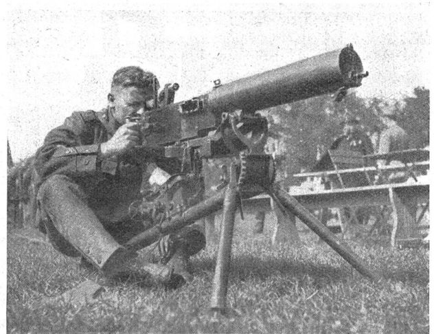
Übungen am Maschinengewehr. — Exercices à la mitrailleuse.

hatte während aller vier Tage außerordentlich lebhafter Betrieb geherrscht, der zeitweise an das Gedränge großer Schützenfeste erinnerte. Sie können schießen, die Unteroffiziere der Schweizerischen Armee! Ihre bewunderungswürdige Handhabung der Waffe hat die schönsten Berechnungen der Verbandsleitung und der Organisatoren der Veranstaltung über den Haufen geworfen! Die höchste Auszeichnung, die Plakette mit Diplom, war auf 90 Punkte festgelegt worden auf Grund bisheriger Erfahrungen. Die Rangliste zeigt, daß mehrere Sektionen mit ihrem Durchschnitt auf dieser respektablem Höhe stehen. Die Schießleistungen erwecken um so größere Bewunderung, als es sich um das schwierigere Scheibenbild B mit Einteilung in 10 Kreise handelt mit einem Zehner von 15 cm Durchmesser, dessen Anblick noch wesentlich erschwert war dadurch, daß das Weiße