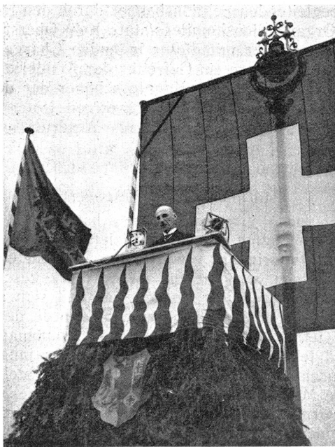
Bundesrat Häberlin spricht zu den schweizerischen Unteroffizieren. Le conseiller fédéral Häberlin cause aux sous-officiers suisses.

herrschte am Samstag bereits in aller Frühe reges Leben. Gewitzigt durch trübe Erfahrungen in Solothurn, wo die am stärksten besetzten Wettkämpfe in den ersten Stunden zu wenig belegt, gegen den Schluß hingegen überlastet waren, hatten sich viele der Konkurrenten zur Pflicht gemacht, mit ihrer Arbeit gleich in der ersten Stunde zu beginnen. Auf der Handgranatenwurfbahn fielen schon die ersten Grenadiere auf durch korrekte Stellungen und taktisch richtiges Verhalten, so daß ein augenfälliger Fortschritt gegenüber Solothurn zu verzeichnen war. Wohl zeigten sich da und dort noch vereinzelte Verstöße gegen die Wurftechnik, die zu Punktabzügen oder zur Disqualifikation führten, aber sie waren viel weniger zahlreich als in früheren Wettkämpfen.