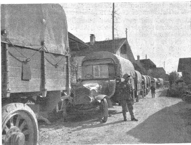
Die schweren Lastwagen zum raschen Abtransport der Truppen von Brügg nach Biel standen zu jeder Zeit in Bereitschaft

Das Aufgebot zum Ordnungsdienst des Landwehrregiments 45 in Biel kam unerwartet rasch. Der Städter rüstete eben für seine Pfingstferien und der Bauer begann gerade mit dem Heuet. Doch trotz des späten Mobil-