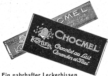
Ein nahrhafter Leckerbissen

WERKSTÄTTE FÜR MODERNE KOMBINATIONS-POLSTERMÖBEL ZÜRICH 1 / UNTERER MUHLESTEG 2 / TELEPHON 53.141