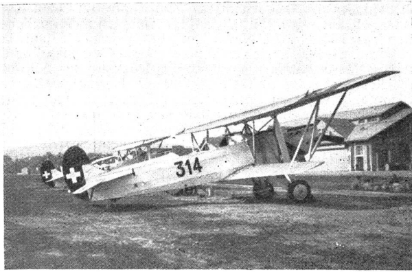
Le CVE. A droite, l'arsenal, avec en haut les cantonnements C. V. E. Rechts das Zeughaus, oben die Kantonmente