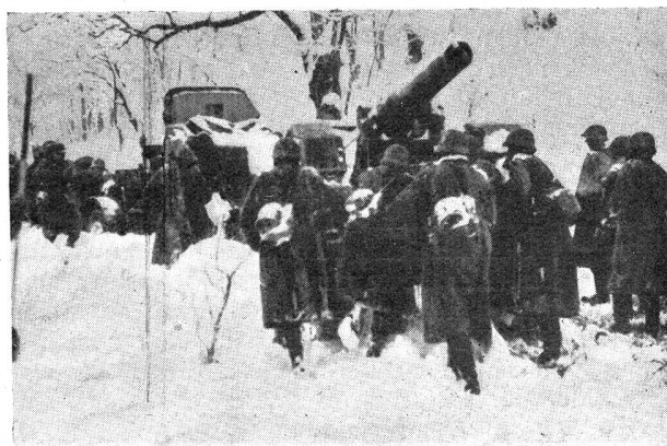
W.-K der Sch. Mot. Kan. Btr. 23