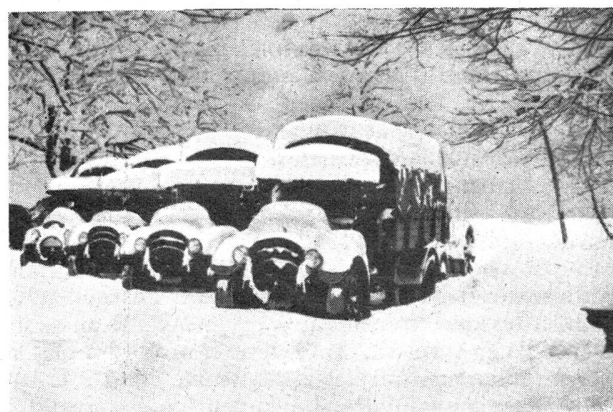
W.-K. der Sch. Mot. Kan. Bttr. 23

Der Artikel von Kamerad Alder beweist, daß die Folgen