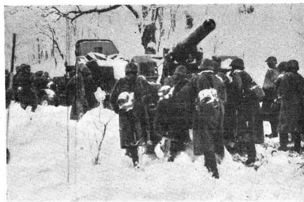
W.-K der Sch. Mot. Kan. Btr. 23