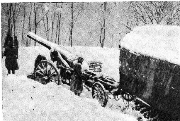
W. K. der Sch. Mot. Kan. Btr. 23

Nach erfolgtem Abgürteln verläßt das Geschütz seine Stellung