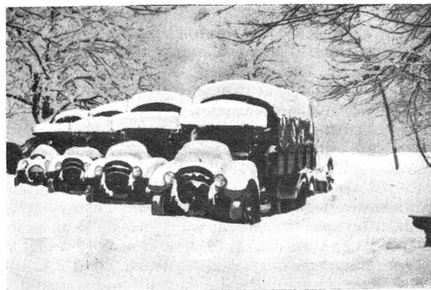
W.-K. der Sch. Mot. Kan. Btr. 23 Lastwagenpark nach dem großen Schneefall C. R. de la batterie de canons lourds tractés 23 Parc d'auto-camions après la grande chute de neige