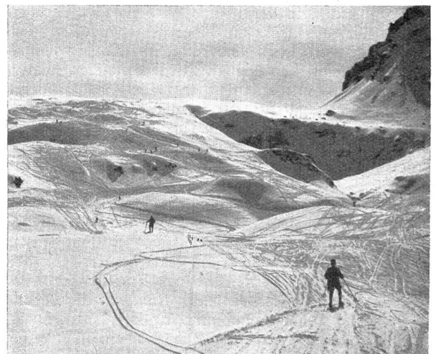
Abfahrtsgelände oberhalb Gaffia Champs de descente au dessus de Gaffia

Der Fourier ist für den Postdienst der Einheit und für die Ordnung und Arbeit im Büro verantwortlich. Er kommandiert die Postordonnanz zu allen Fassungen, bei welchen Post übernommen wird, und teilt ihr alle Mutationen in der Einheit mit. Er führt das Taschenbuch des Rechnungsführers. Er verwaltet getrennt die allgemeine Kasse, die Haushaltungskasse und allfällig von Leuten der Einheit ihm zur Verwahrung übergebenes Geld.