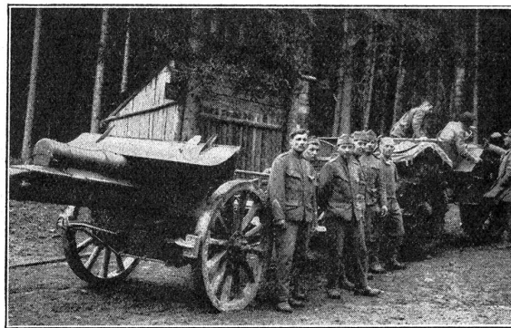
Bei unseren „schweren Haubitzen“

Gegen Sonnenuntergang sind wir in St. Maria. Und wieder, wie schon hunderte Male erstrahlen die Berge im Purpurglanze. Gleich einem leblosen Beet der aller schönsten Alpenrosen strahlt das tiefrote Firmament.